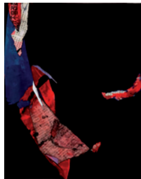
S/T, 2009. Collage sobre papel. 31 x 25 cm.

Emoción ante los hallazgos, pero también la duda permanente. Ambos sentimientos me acompañan en la perseverante dedicación para militar en esto de la pintura.