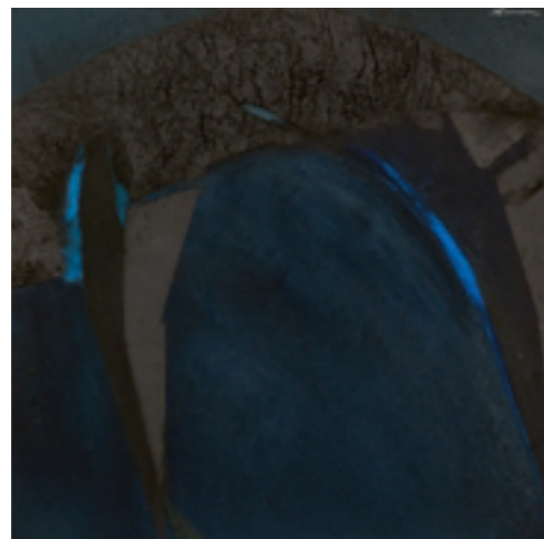
Pintura instante , 2005. Técnica mixta sobre tabla. 20 x 20 cm.

“No sé cuánto camino llevamos recorrido, ni cuánta sombra ni cuánta luz hemos dejado lejos...”