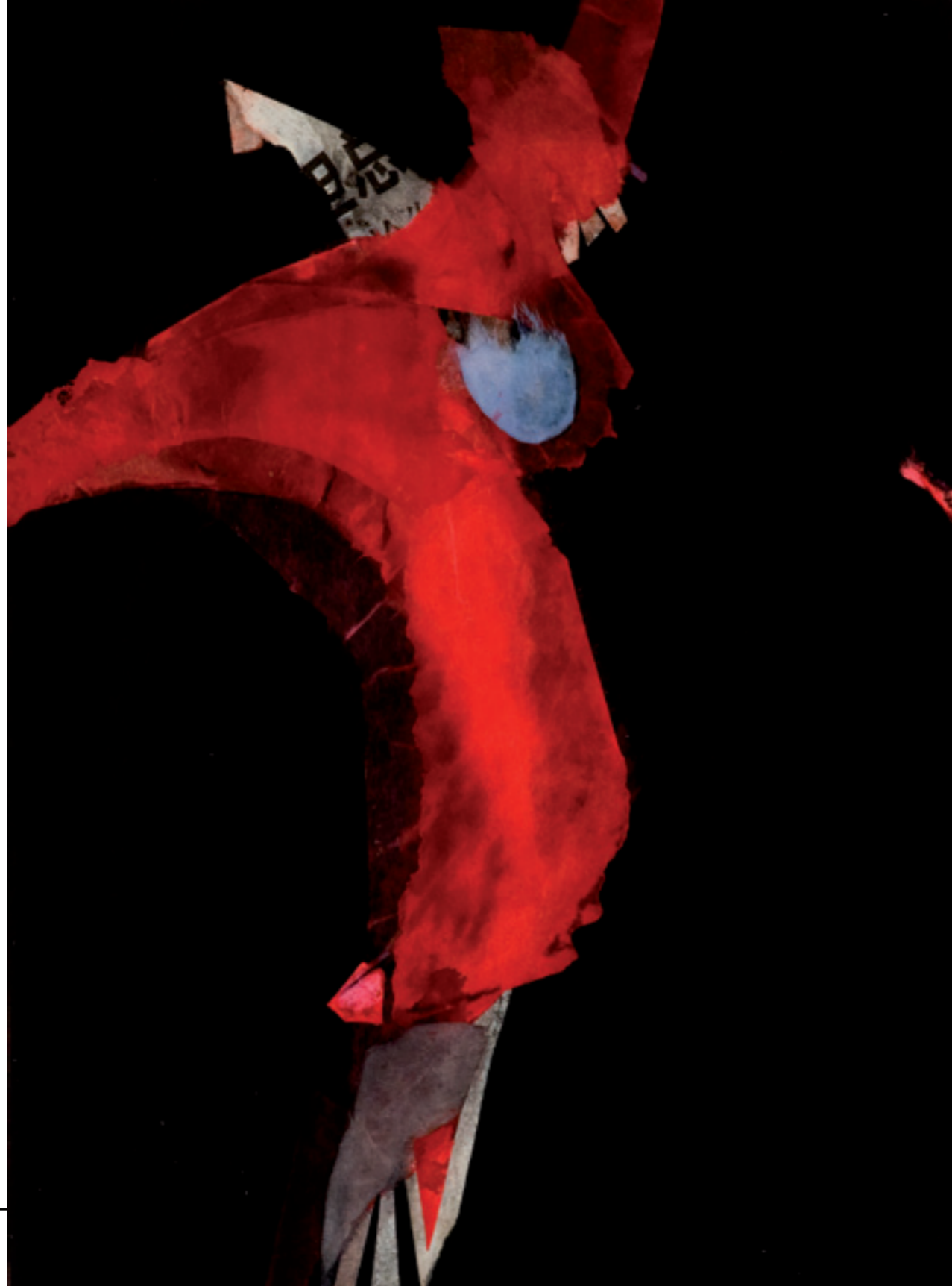
S/T, 2009. Collage sobre papel. 27 x 20 cm. ►